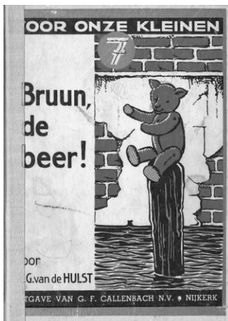
W.G. van de Hulst, Bruun de beer , negende druk, [1952].

De zon schijnt nog een beet-je. De zon schijnt net in dat knoop-je van glas. Kijk, de quit! Hij maakt een knip-oog-je. 't Is net, of hij je fop-pen wil.