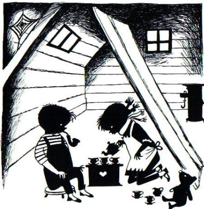
'Jip wil geen thee drinken', Het Parool , 25 oktober 1952, potlood en inkt, 18 x 16,5 cm.