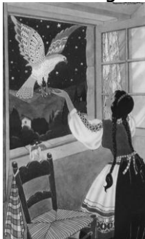
Illustratie van Nans van Leeuwen bij 'Finist de wakkere valk' in Groot Sprookjes Boek

Die passie heeft ze van haar ouders geërfd. Haar vader, die de kost verdiende als ziekenfondsbede en later als melkboer, was gek op lezen en las zijn kinderen graag voor. Haar moeder deed soms tussen zes en negen uur 's morgens het huishouden om daarna te kunnen lezen, tot verwondering van de buurt. Dat voorlezen, onder meer uit de Prélientje- en Drie stouterdjes- boekjes van de wasmiddelenreclame en uit het Groot Sprookjes Boek van het tijdschrift Margriet , stimuleerde Janneke om zelf te gaan lezen.