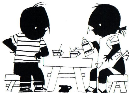
'Jip wil geen thee drinken', 1963, tekening in pen en inkt, 9 x 11,5 cm.