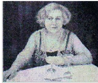
Karin Michaëlis, ca 1931

Velen van ons zullen Karin Michaëlis kennen van de boeken over Bibi, een Deens meisje dat allerlei reizen maakt omdat haar vader bij de spoorwegen werkt en van Lotte's grote feest . Geboren als Katharina Bech-Bröndum leefde ze van 20 maart 1872 tot 11 januari 1950.