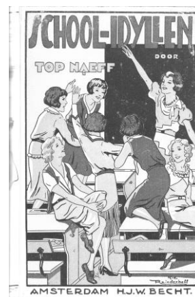
Zestiende druk van School-Idyllen door Top Naeff (1936).