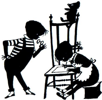
'Jip is de meester', Het Parool 12 december 1952, inkt, 14,5 x 13,5 cm.

teruggebracht. Het is razend knap hoe Fiep met enkele lijnen de essentie van de dingen weet te treffen. De plaatjes zijn misschien wel geraffineerder geworden, maar eigenlijk houd ik toch het meest van de vroegere afbeeldingen, die me herinneren aan Het verloren schaap , Versjes uit de Grabbelton en Versjes uit de nieuwe doos van Han G. Hoekstra, waar ik in mijn jeugd zeer aan verknocht was. Het leukste vond en vind ik de zwierige houdingen waarin allerlei mensen zijn afgebeeld, volkomen onmogelijk, maar toch ook herkenbaar. Later is dat er een beetje uit gegaan en zijn de personen meer vierkant en compact geworden. De onderstaande voorbeelden laten zien wat ik bedoel.